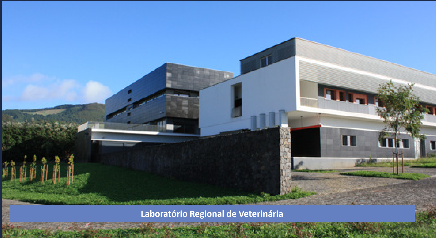
Laboratório Regional de Veterinária