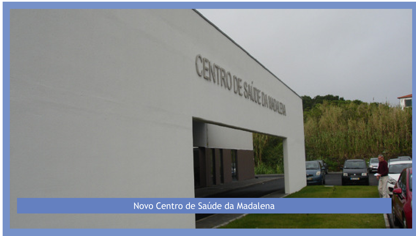
Novo Centro de Saúde da Madalena