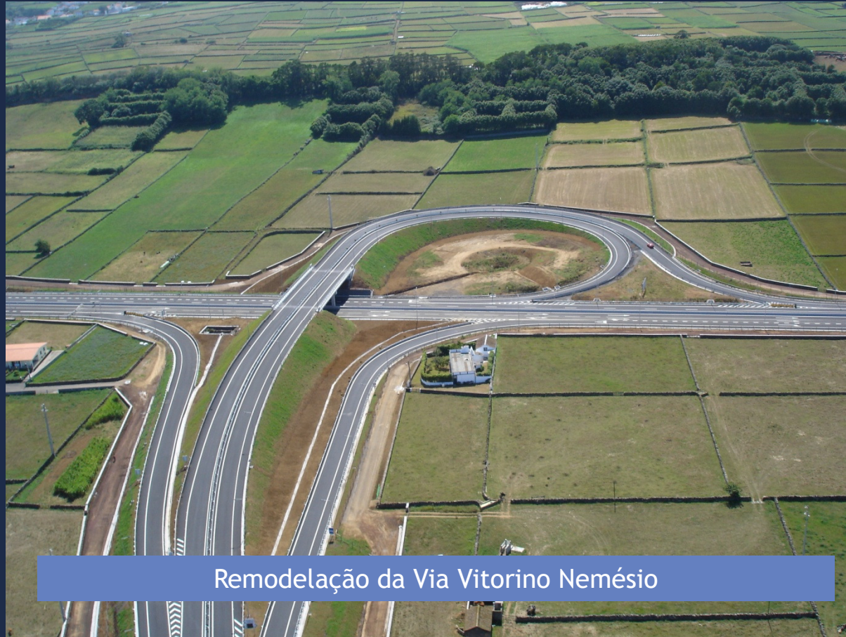
Remodelação da Via Vitorino Nemésio