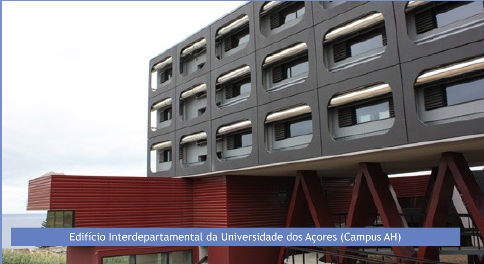
Edifício Interdepartamental da Universidade dos Açores (Campus AH)