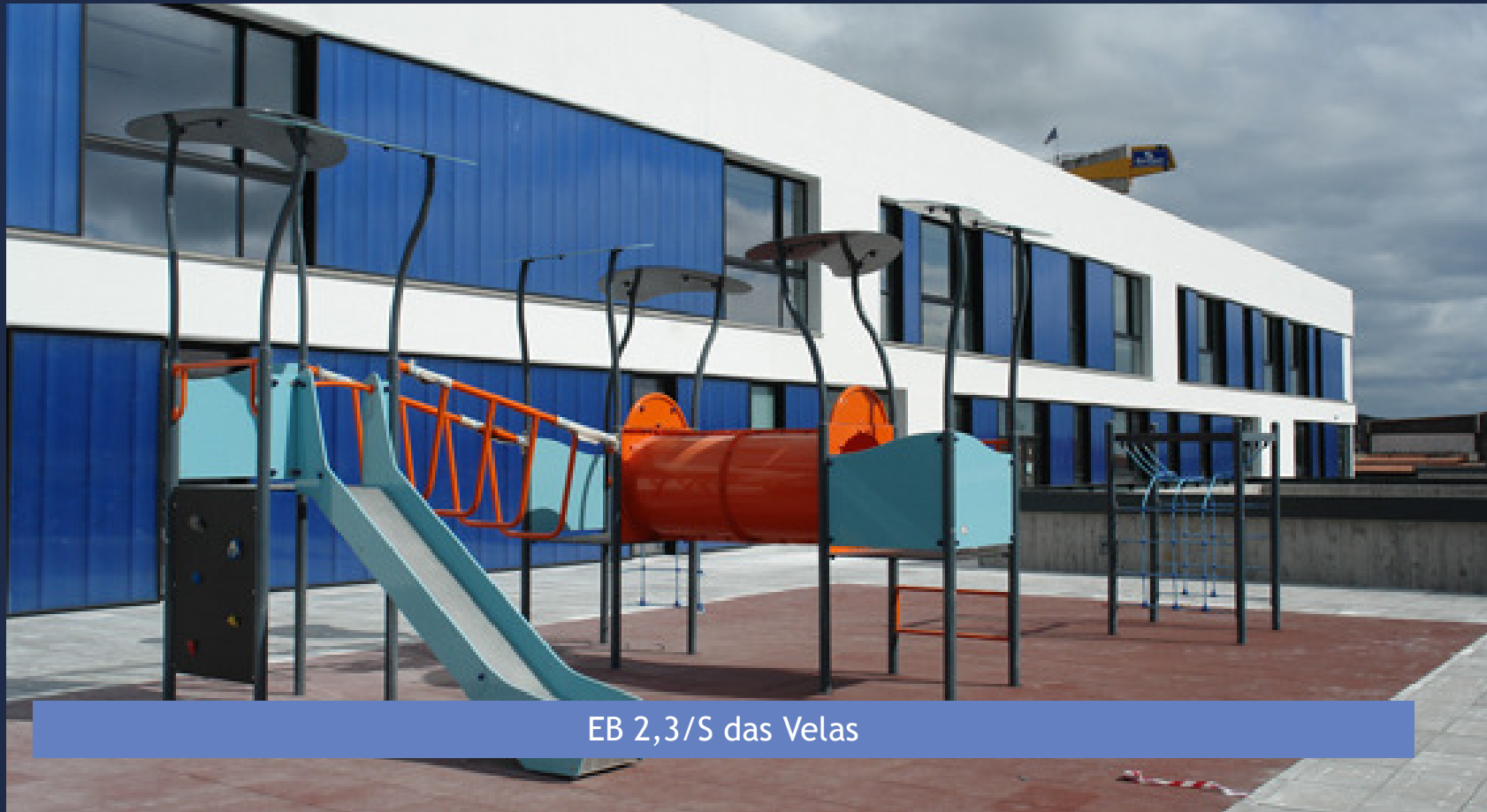
EB 2,3/S das Velas