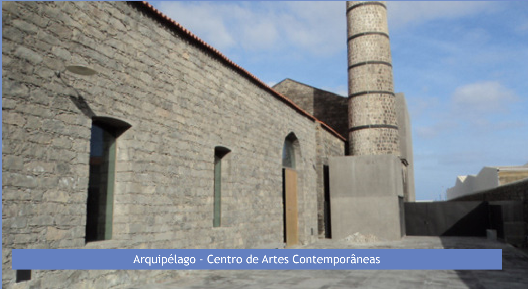
Arquipélago - Centro de Artes Contemporâneas