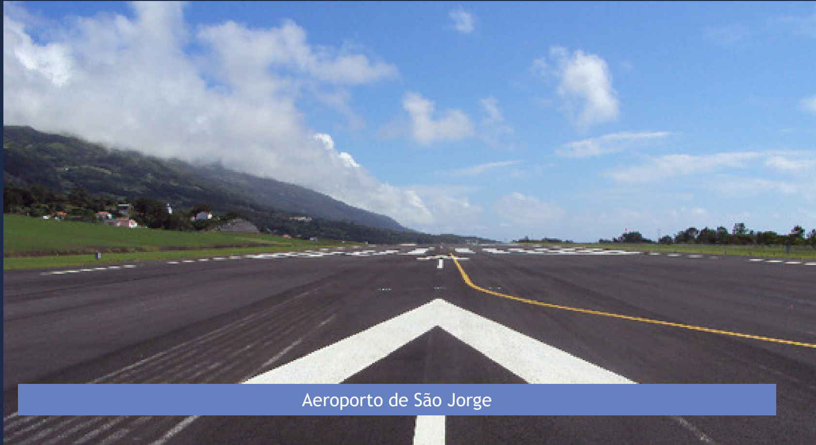
Aeroporto de São Jorge