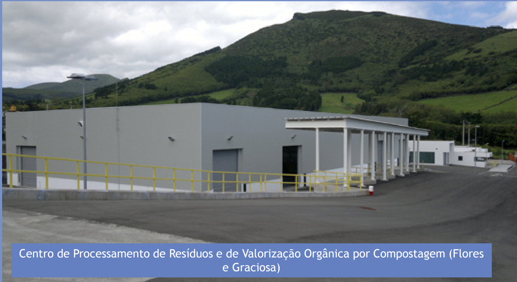
Centro de Processamento de Resíduos e de Valorização Orgânica por Compostagem (Flores e Graciosa)